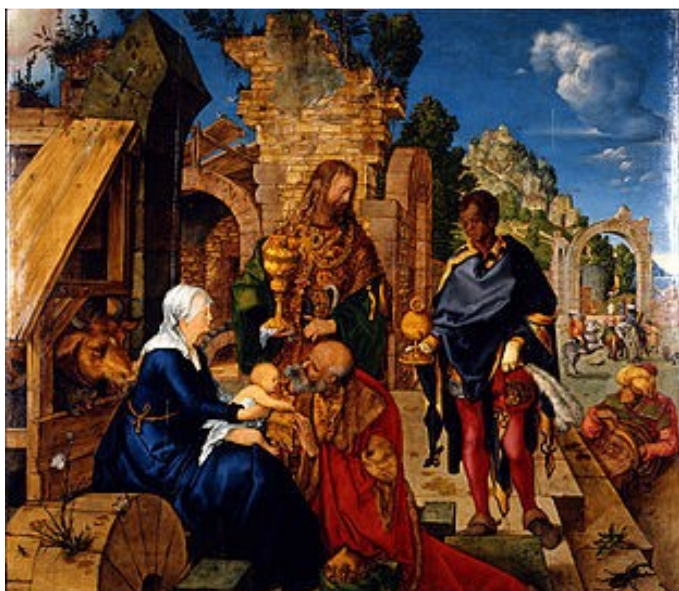
Albrecht Dürer, Klanění tří králů, olej na plátně, 98×111 cm, 1504, Galleria degli Uffizi, Florencie

V západní liturgické tradici je svátek Tří králů ztotožněn se slavností Zjevení Páně a církev jej na Západě i Východě slaví 6. ledna. Tento svátek je svou podstatou totožný se slavností Narození Páně, je dvanáctým dnem Vánoc a fakticky jím Vánoce vrcholí a končí. Svátek Tří králů upomíná na okamžik, kdy se Kristus zjevuje nejen izraelskému národu, ale všem; dává se rozpoznat jako král všech, které zastupují mudrcové z daleka.