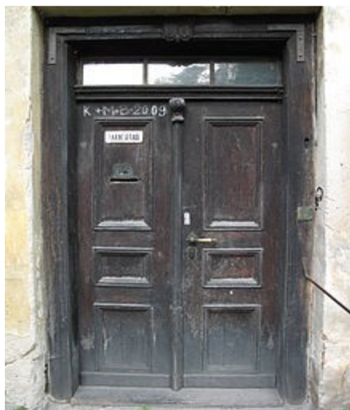
Požehnání na dveřích fary ve Lstiboři, okres Kolín